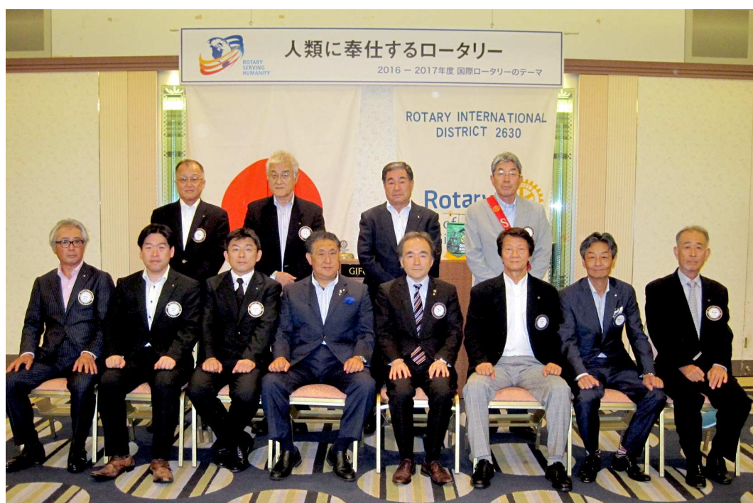
第27期 岐阜中ロータリークラブ 理事役員一同

秋保新会長、誠におめでとうございませう。陰ながら応援してまいりたいと思ひます。フィリピンは行きませうけど。