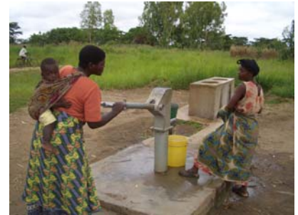
手押しポンプ井戸

日本から約 12,000 km、赤道直下のこんなに遠くによく来たもんだ。このマラリアプロジェクトのチームには長崎大学の熱帯医学研究所の医師団、NICCOの現地スタッフ、現地医療チームで構成され、私はそれぞれの人々の協力を得て無事に調査を完了した。環境調査の結果として物理的手段である蚊帳はマラリアの予防には現時点では最高の手段である。今回のプロジェクトでは感染率を雨期と乾期において年間 2 回のモニタリングを行っている。前回は 55%・今回は 33%と良好な結果で、あと一年の調査を継続の予定である。雨期に於ける水溜りや池に殺虫剤の散布等の手段にも限度があり、又継続することにも環境汚染につながる現実をかかえこんでしまう。