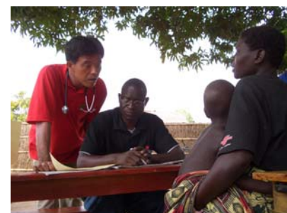
ドクターによる診療検査 ①