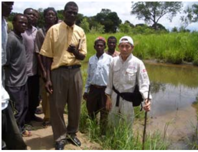
池（ポーブラの確認）