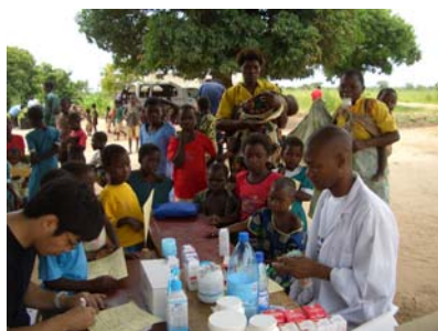
ドクターによる診療検査 ②