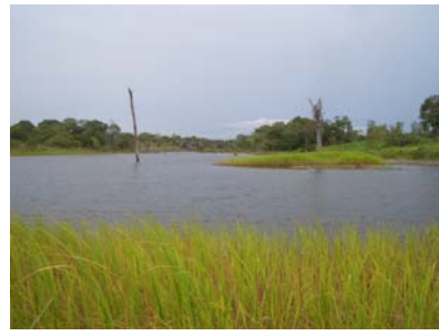
湖、農業用水に使用されている