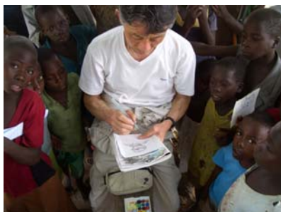
休憩時に似顔絵を描く

日本から約 12,000 km、赤道直下のこんなに遠くによく来たもんだ。このマラリアプロジェクトのチームには長崎大学の熱帯医学研究所の医師団、NICCOの現地スタッフ、現地医療チームで構成され、私はそれぞれの人々の協力を得て無事に調査を完了した。環境調査の結果として物理的手段である蚊帳はマラリアの予防には現時点では最高の手段である。今回のプロジェクトでは感染率を雨期と乾期において年間 2 回のモニタリングを行っている。前回は 55%・今回は 33%と良好な結果で、あと一年の調査を継続の予定である。雨期に於ける水溜りや池に殺虫剤の散布等の手段にも限度があり、又継続することにも環境汚染につながる現実をかかえこんでしまう。