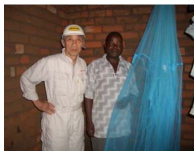
活躍中のオリセットネット