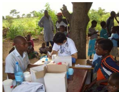
ドクターによる診療検査 ③