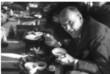
日本の東京で、箸を使って食事するロータリー創始者、ポールP.ハリス。(1935年2月)